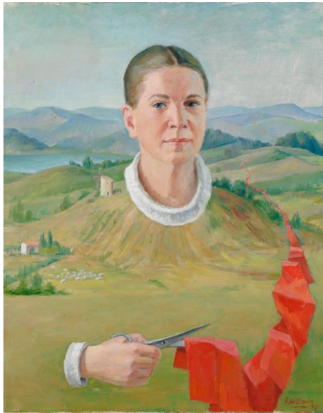
Åke Hellman: Saxen (Karin) (1970), Finlands Nationalgalleris samling.