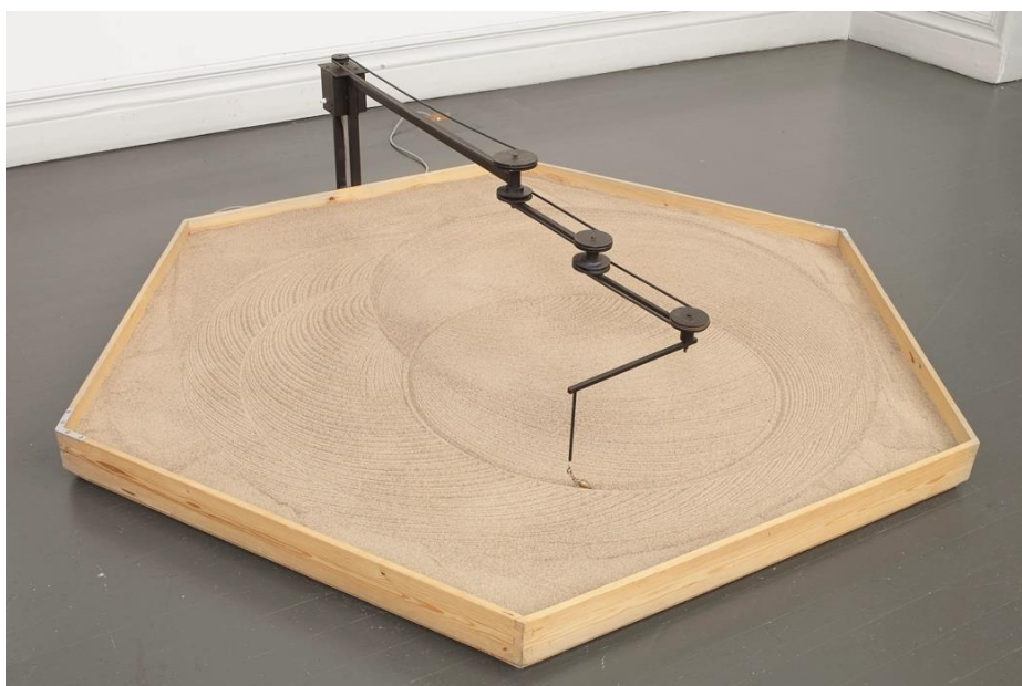
Osmo Valtonen: Circulograf (1983,) Finlands Nationalgalleris samling.