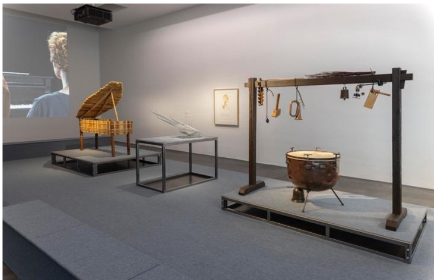
Jani Ruscica: Flatlands (2018), Finlands Nationalgalleris samling.