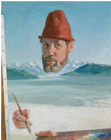
Åke Hellman: Målaren (Självporträtt mot arktisk fond), (1970), Finlands Nationalgalleris samling.