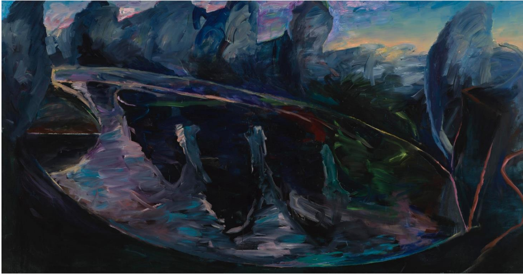
Leena Luostarinen: Pipers damm (1984), Finlands Nationalgalleris samling.