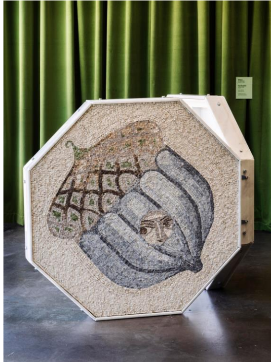
Riikka Anttonen: Mitt lilla skåp (2023), Finlands Nationalgalleris samling.