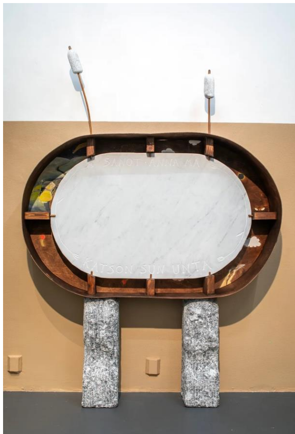
lisa Lepistö: Du säger, låt mig titta på din dröm (2023–2024), Finlands Nationalgalleris samling.